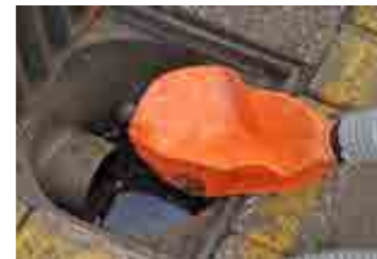
Bevestig de ROM SmokeStopper aan het uiteinde van de rooktoevoerslang