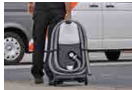
art. 0598001 ROM eSTEAM Rookgenerator