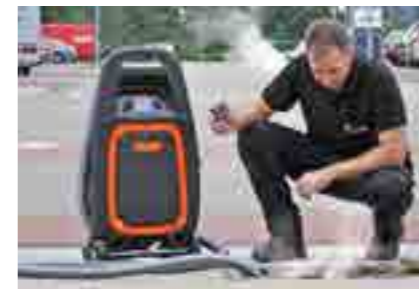
art. 0598002 ROM eSTEAM Rookgenerator, incl. afstandsbediening