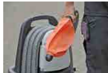
art. 059600 ROM SmokeStopper