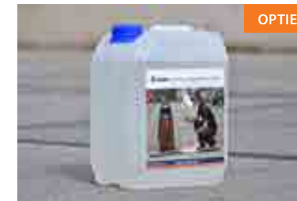
art. 0598010 ROM Rookvloeistof, 5 liter