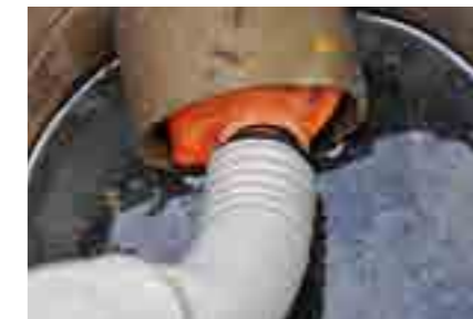
De leiding wordt automatisch luchtdicht afgesloten zodra er rook door de slang gaat